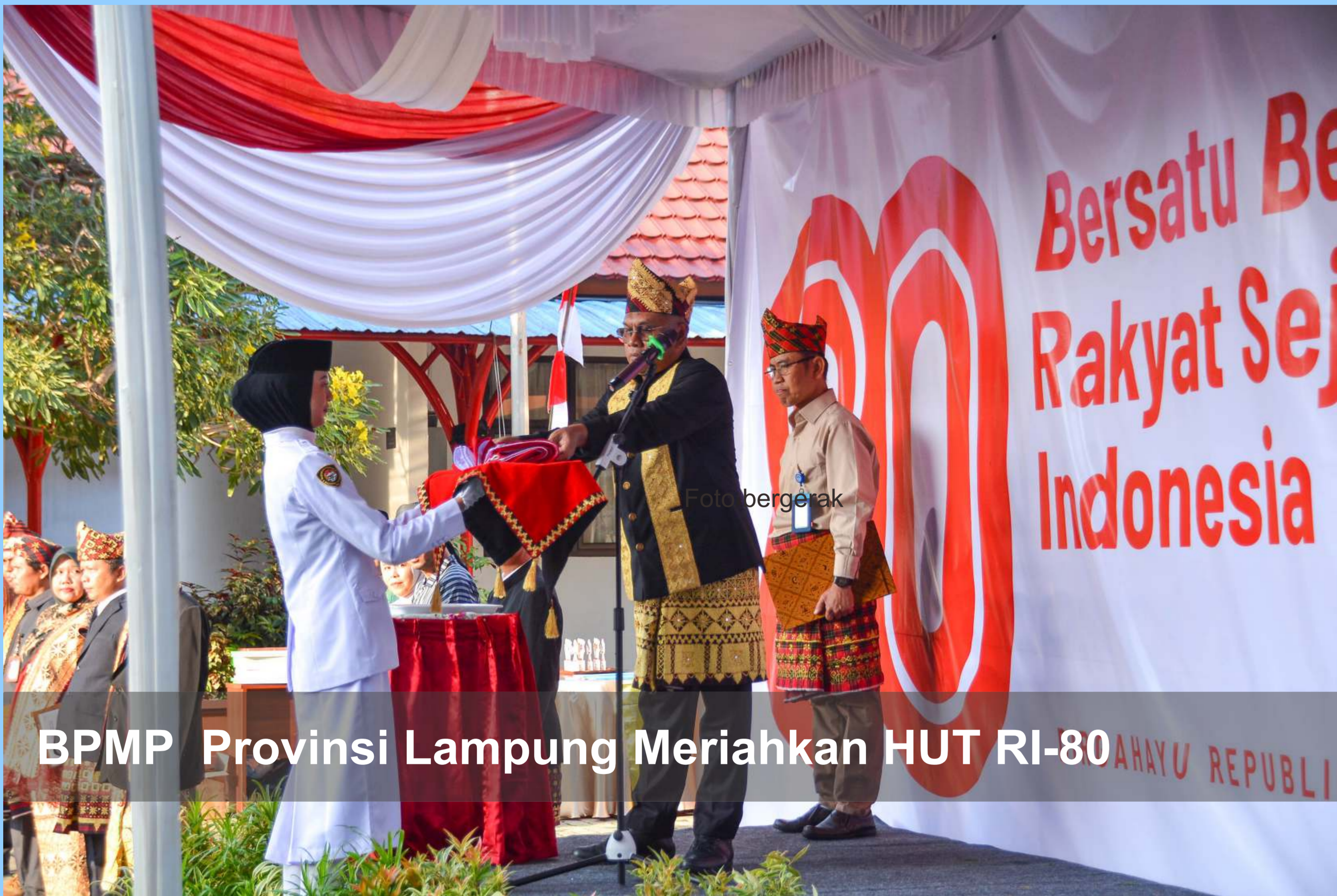
BPMP Provinsi Lampung Meriahkan HUT RI-80