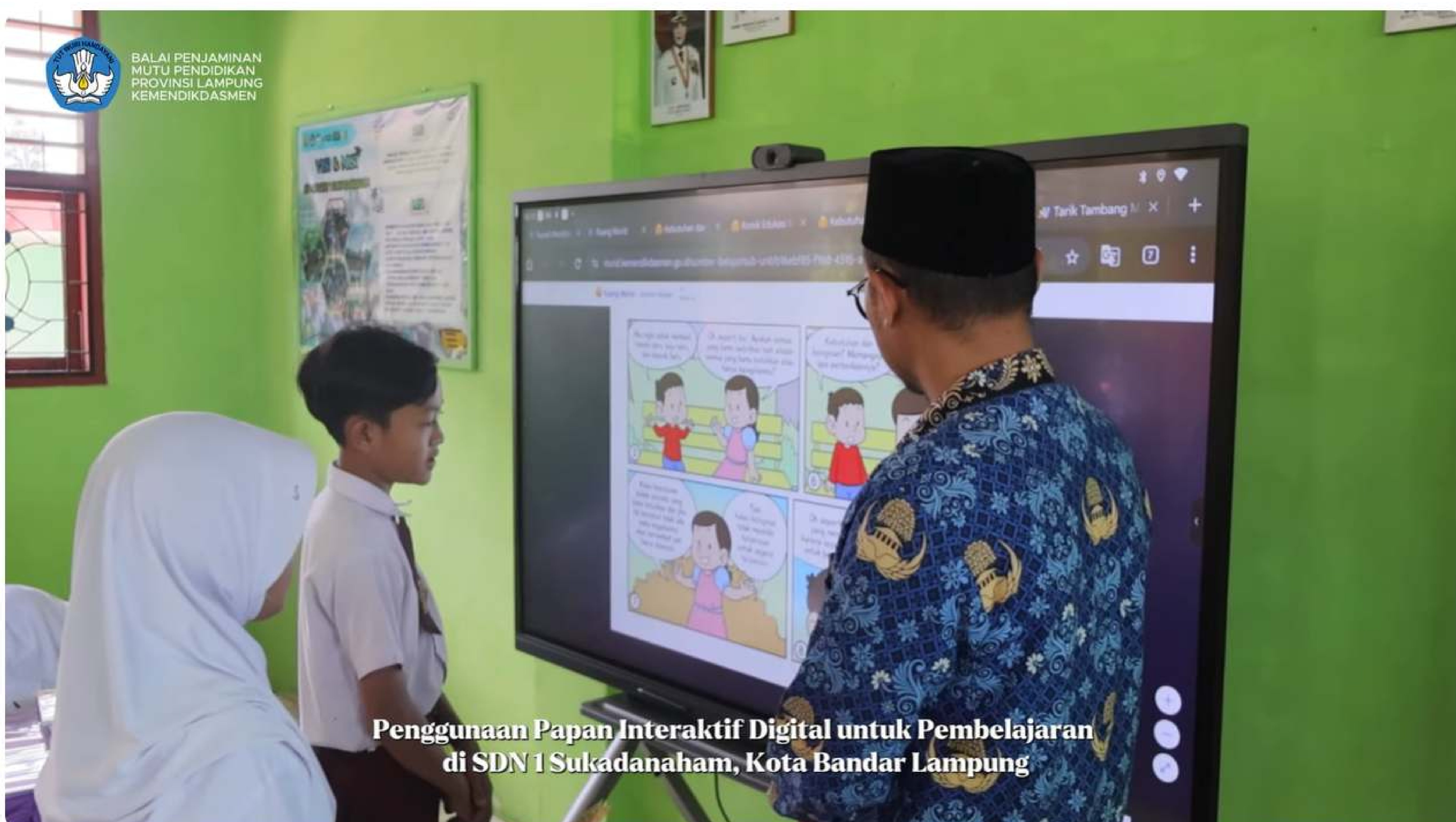
Penggunaan Papan Interaktif Digital untuk Pembelajaran di SDN 1 Sukadanaham, Kota Bandar Lampung